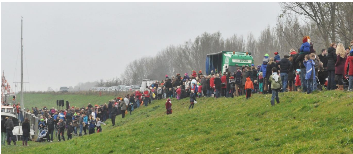
Zoals gebruikelijk is er geen doorkomen aan voor Sinterklaas en zijn Pieten