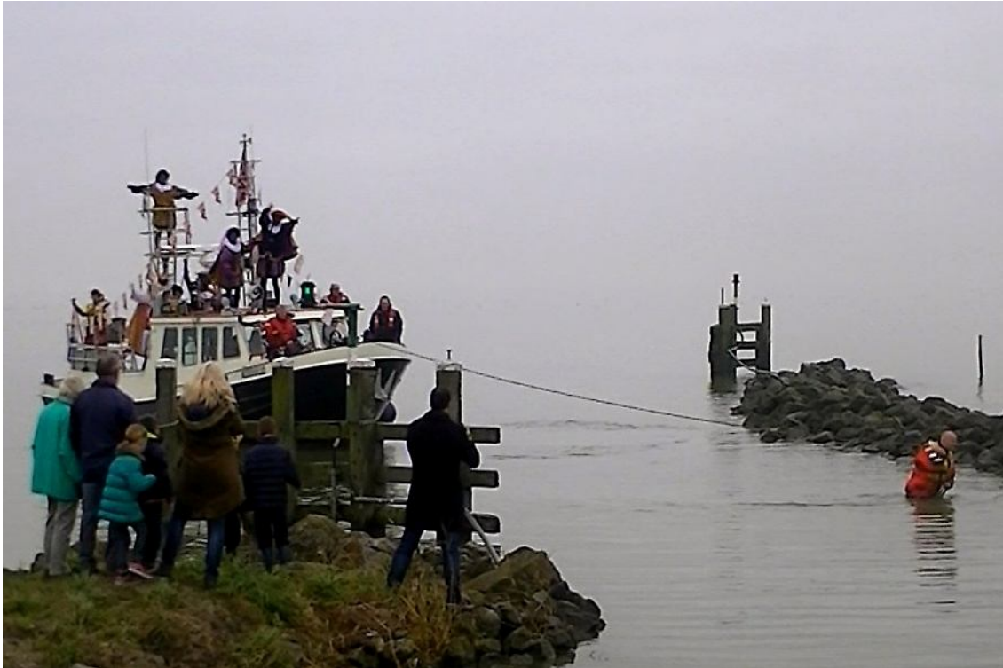
Onze eigen Jerommeke trekt Pakjesboot 13 naar binnen

Het was even spannend of Pakjesboot 13 dit jaar wel de haven van Wijdenes binnen zou kunnen varen. Ze liep inderdaad vast in de havenmond. Maar 1 van onze sterke opstappers was zo vriendelijk om haar op de hand de haven binnen te sjoeren. Gelooft u dit echt? Dan gelooft u vast ook nog in de oude baas uit Spanje.