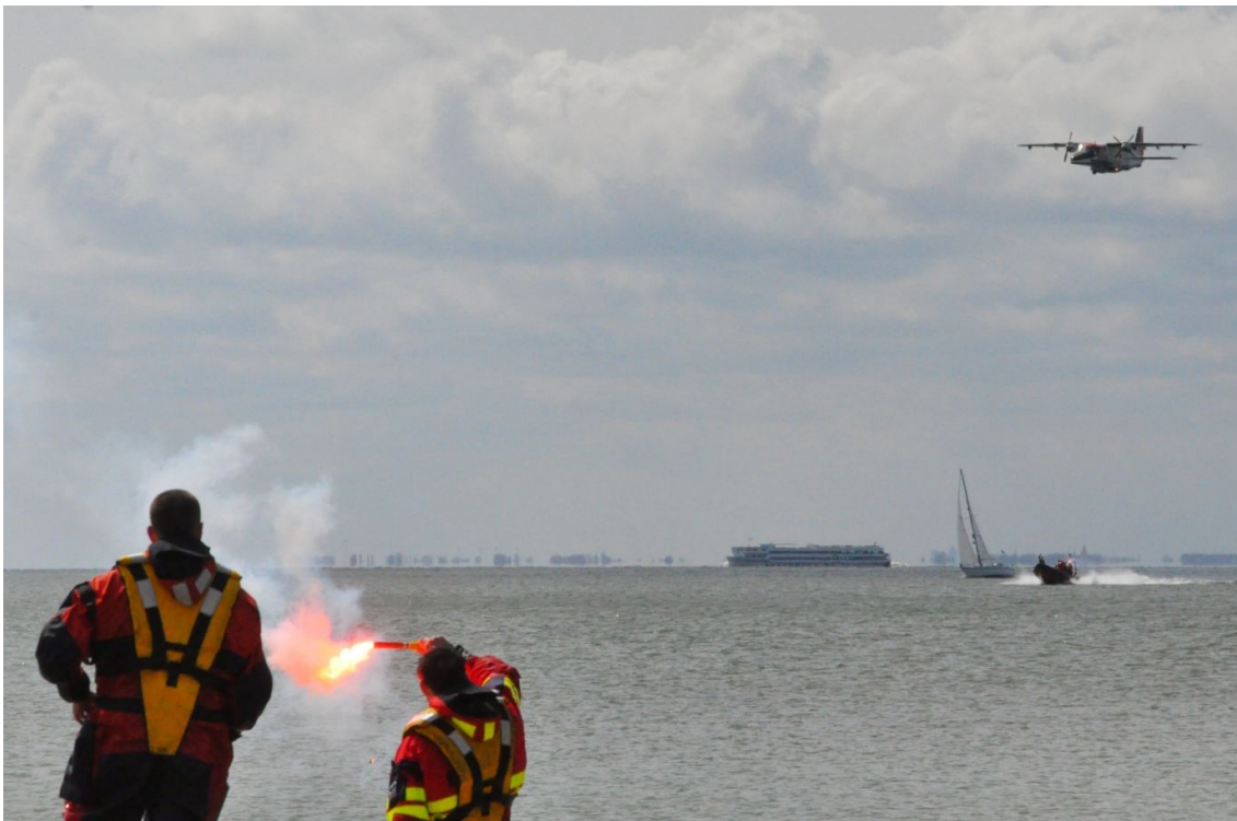
Fly-by van het Kustwachtvliegtuig welke een vanaf boot en wal met fakkels uitgezette route vliegt

Dit jaar was deze dag extreem spectaculair. De grote bezoekersopkomst was mede te verklaren door het bezoek van het Kustwachtvliegtuig en de demonstraties die zijn gegeven in samenwerking met de SAR-heli van NOGEPA uit Den Helder.