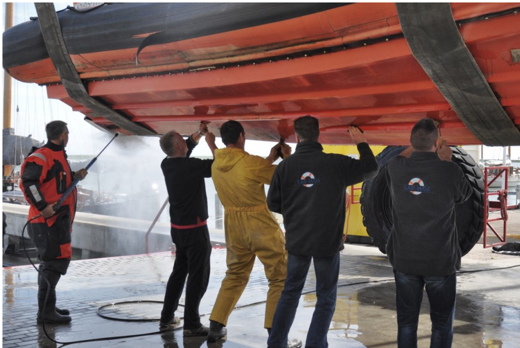
Veel handen nodig om te helpen bij het repareren van het onderschip van de Mantelmeeuw.

Foto voorpagina: 2 opstappers worden gehoist door de SAR-heli van NOGEPa