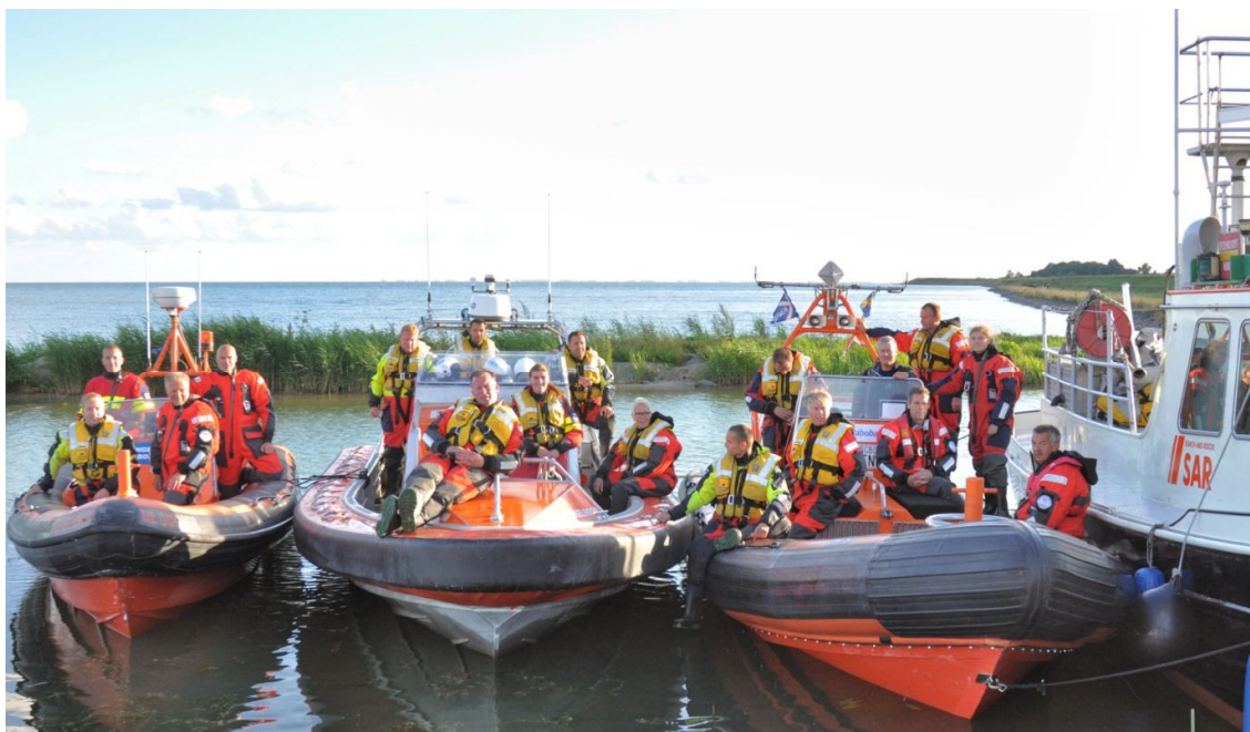
Galafoto van de boten van KNRM-station Lelystad en van KNRM-gelieerd station Wijdenes

Ook met de burens van Hoorn is verschillende malen geoefend. Men is in Hoorn nu alles op alles aan het zetten om een eigen Reddingsstation op te zetten. Hopelijk krijgt ze in 2014 de KNRM-gelieerden status wat betekent dat ze door de Kustwacht gealarmeerd kunnen worden. Betekent voor ons dat we niet meer heel lange halen hoeven te maken als er een drenkeling ter hoogte van de steiger van de Hayo ligt (wat helaas de afgelopen jaren wel degelijk af en toe is gebeurd).