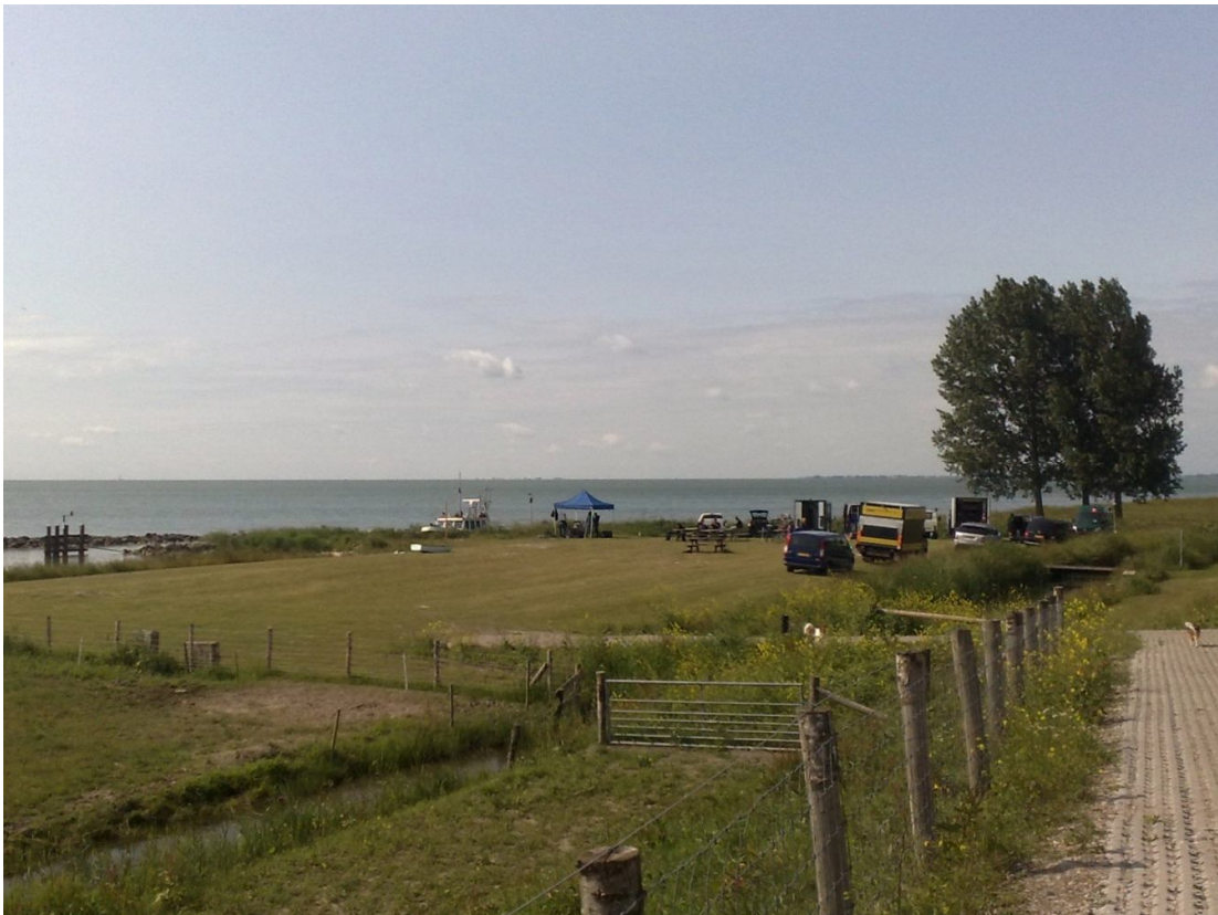
Haven van Wijdenes in gebruik tijdens de opnames voor reclamefilm "de Optimist"

Een groot aantal gestelde doelen uit het beleidsplan is gehaald. Maar daar waar wij mede afhankelijk zijn van derden blijkt een en ander langer te duren dan door ons voorzien.